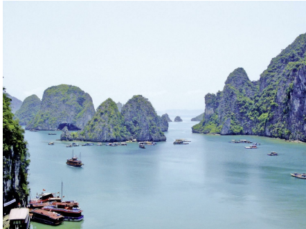
(Landeskategorie: 4 Sterne). (A)